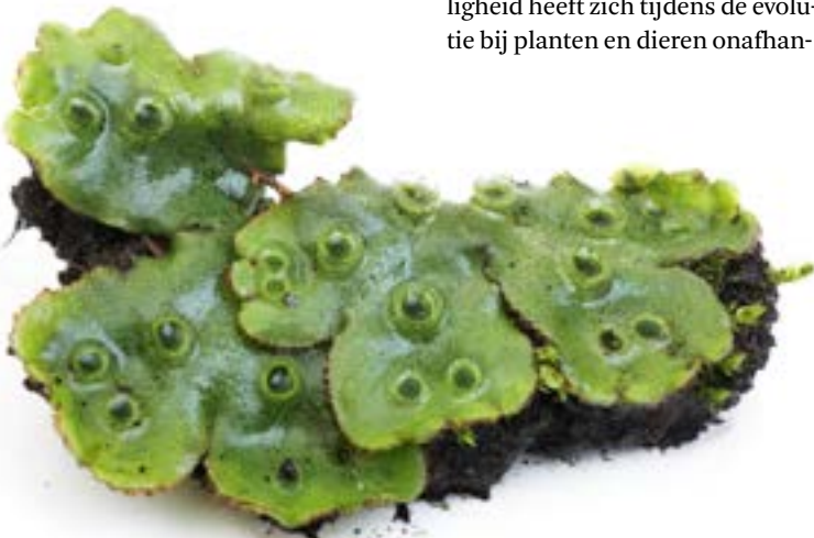
◀ Zelfs de alleroudste levermossen gebruiken het systeem met kompas-eiwitten, wat betekent dat het minstens 450 miljoen jaar oud is.

Begin 2019 sleepte Weijers een Advanced Grant van de European Research Council (ERC) van 2,5 miljoen euro in de wacht. Dat geld gaan hij en zijn team gebruiken om de werking van het plantenkompas verder in kaart te brengen. 'We weten dat de eiwitten kunnen sturen welke kant de cel opdeelt; nu willen we onderzoeken hoe dat allemaal samenhangt. We weten bijvoorbeeld niet wat voor signaal er gegeven wordt via de kompas-eiwitten en hoe dit zich precies vertaalt naar celdeling. Dat is een heel avontuur, omdat het nog grotendeels onontgonnen terrein is.' TL